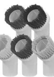
HP掃除機ノズルブラシ