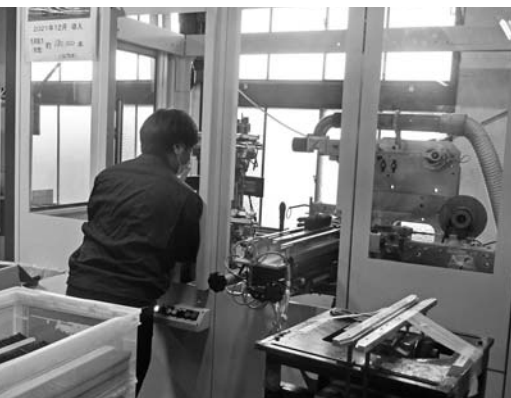
3台目となる種毛機を増設し、海外からの受注に対応する生産体制を確立した