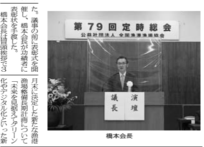
第79回定時総会 公設社団法人 全国漁港漁場協会