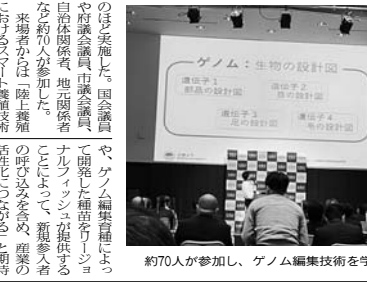
約70人が参加し、ゲノム編集技術を学んだ

ゲノム編集技術の勉強会 リージョナルフィッシュが京都で開催 リージョナルフィッシュが、ゲノム編集技術の勉強会を京都で開催した。約70人が参加し、ゲノム編集技術の基礎から応用までを学んだ。講師は、ゲノム編集技術の専門家であり、リージョナルフィッシュの代表取締役である。勉強会では、ゲノム編集技術の基礎から応用までを学んだ。講師は、ゲノム編集技術の専門家であり、リージョナルフィッシュの代表取締役である。