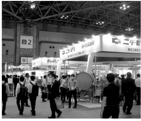
食品製造の最先端技術が集結